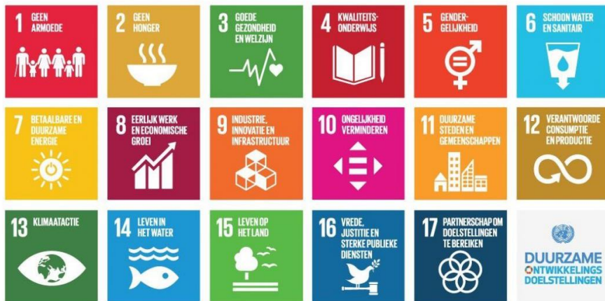
Fig 4: Alle SDG's vormen de definitie van De Haagse duurzaamheids- en rechtvaardigheidsambitie

In de scope van dit programma ligt het monitoren van de samenhang met andere inspanningen die de beoogde baten mede beïnvloeden. PMO is verantwoordelijk voor proces SustainaBul, communicatie uitvoering, community building en studenten-led activiteiten.